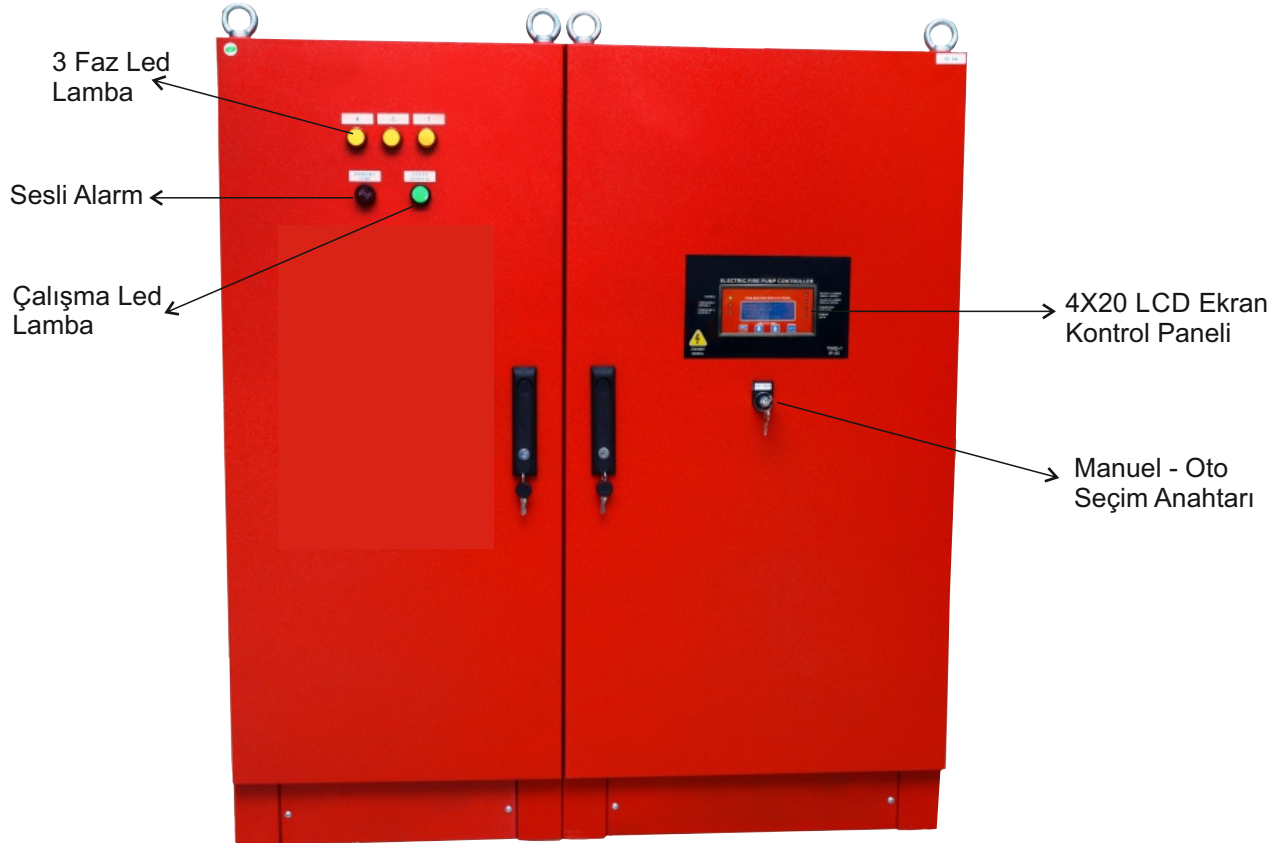
Şekil 1: TRF.OTO Pano Ön görünüş